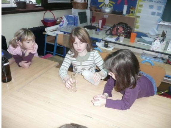
Boca štrcaljka je baš fora