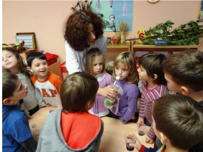
Razvoj analitičkih metoda

Ups, greška u proračunu, tako je zabavnije.