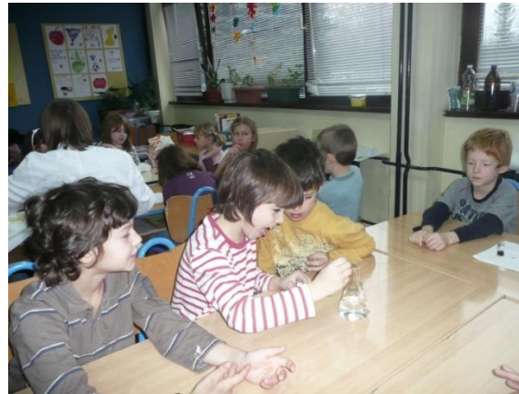
Mala špatula isto tako