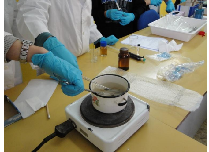
Bez šišmišjih krila, kralje balege i vilinske prašine.