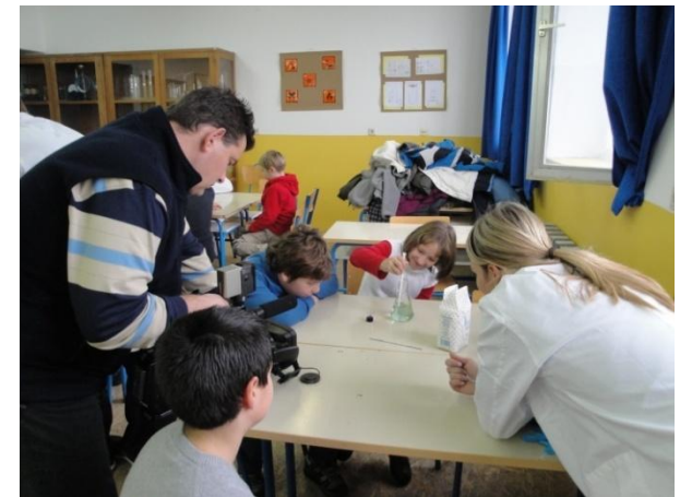
Promiješamo i boje se izmjenjuju, od roza do plave, pa zelene i na kraju žute