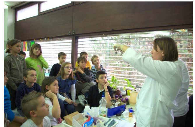
Čarobno srebrno ogledalo