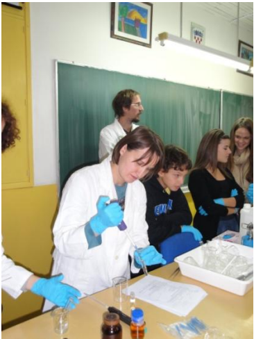
pa još malo prozirne tekućine