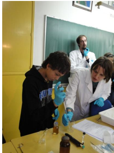
Ajde još malo prozirne tekućine