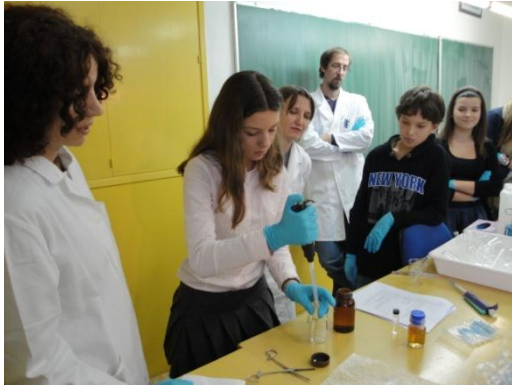
Malo prozirne tekućine